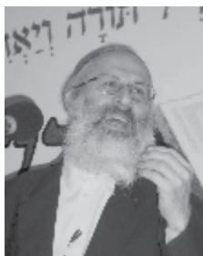
שופר מרכזי של הורם. הרב שלמה אבינר.

לאחר זיהוי הסמארטפון ככלי המשמש בידי הטומאה להשכחת "האני העצמי" של האומה, הרב טאו עובר להצגת הפתרון. הוראתו המעשית המוצגת בחוברת חדה וברורה: "תקבור את המכשיר שלך לפני שהוא קובר אותך", הוא כותב, ומתריע בפני מי שלא ינהגו כך כי "לבעלי מכשיר זה אין טעם לבוא לשמוע שיעורים". בהמשך הוא עורך הקבלה בין החזקת סמארטפון לעבודה זרה: "מי שמאמין בריבוננו של עולם ילך אחריו, ומי שבעל אייפון ומאמין בבעל ילך אחריו... להכניס מכשיר זה לבית המדרש וללמוד תורה יחד אתו – זה לא שייך". אמנם, מודה הרב טאו, ניתן למצוא נקודות חיוביות במכשיר, אך "כל אדם מבין כי ההפסד המוסרי הנגרם בעקבות השימוש במכשירים אלו אינו כדאי כלל לעומת שום רווח". מקרה חריג שבו הרב טאו מתיר שימוש במכשיר הוא לצורכי עבודה, אך גם זאת בתנאי שהמחזיק יהיה "מלא בצער על כך שהוא נאלץ להשתמש במכשיר מסוג זה", ורק אחרי שסינן מהמכשיר את כל מה שאינו נחוץ לעבודתו.