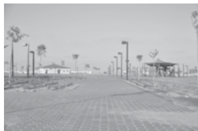
חקלאות העבר היא העתיד האמוני. תמונה ממושבו נווה בנגב המערבי המזוהה עם תלמידי ה'קף'.

לא ניתן להבין את החוברת לאשורה בלי להכיר את תפיסתו ההיסטוריוסופית של הרב טאו; זו מושתתת על תפיסה היסטורית דיאלקטית מבית מדרשו של הגל. לשיטתו, תהליך הגאולה נדחף קדימה על הציר ההיסטורי על ידי כוחות המתנגדים לו; הטומאה המתעמתת עם התהליך האלוהי מדגישה את הקודש באמצעות הצגת היפוכו, וכך מבררת את הקודש מן החול. כלפי חוץ נראה לעתים כי יש נסיגה בגאולה, אך המתבוננים החודרים לעומק יודעים כי הגאולה מתקדמת בכוח גזרה אלוהית. התעוררות החול מופיעה תחילה, משום שהקודש "זקוק לבסיס איתן שעליו יחולו ערכיו", 20 ולכן בשלב זה יש התנכרות לדת. אך שלב החול סופו שייסדק; הלאומיות תבוא לקצה וזמנה של קומת הקודש יבוא. קומה זו תשיב את העם כולו לחיי תורה ומצוות ולהכרה ביעוד האמתי של העם היהודי.