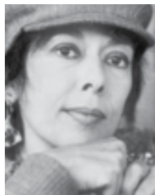
אל תחזיק את לא חייך. וולך המאוחרת

אחרי שנים של קריאה ב'צורות' ו'מופע', ברור לי היום שמדובר בשירי מראה הפוכה לשירי 'דברים' ו'שני שנים'; בתכתובת פנימית, בכתב סתרים שאכן נראה שתום או אסוציאטיבי אם לא קוראים אותו לאור השירים המוקדמים. כדי לפענח את הצופן, כדי להבין את הקטסטרופה של החיים, דרושה לנו עבודת השוואה יסודית בין הניסיון להיות אלוהים של וולך המוקדמת לבין ההודאה המאוחרת בכישלון, בין הניסיון להבין הכול לבין הניסיון להזהיר מפני הניסיון הזה.