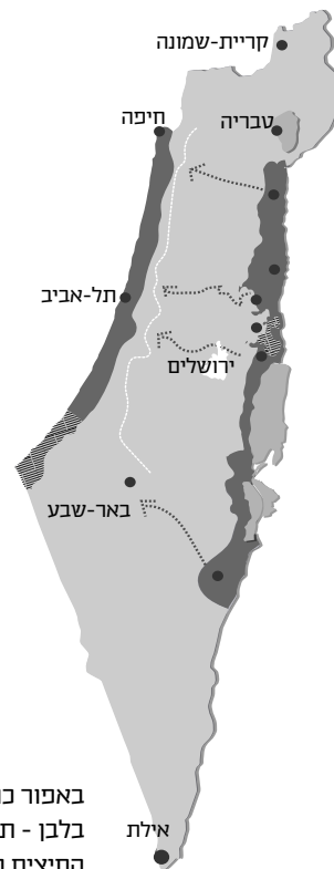
איור 1: שתי השדרות על מפת ישראל הכללית

שְׂדֵרָה כפולה כשמה כן היא: עקרון אסטרטגי בסיסי הבנוי על היגיון פשוט. גשו לברוש צעיר, אחזו בו בשתי ידיים ודחפו אותו בחוזקה בניסיון לכופפו. כעת, גשו לסולם עץ באותו גובה כמו האילן, אחזו בו בחוזקה ונסו לכופפו. הנמשל, דומני, מובן מאליו.