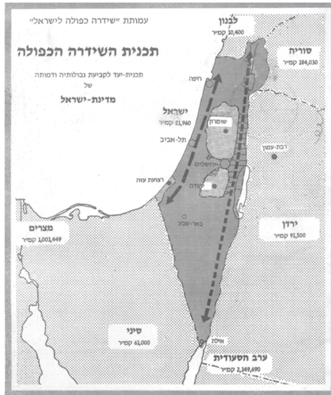
איור 2: השְׂדֵרָה בתוכנית המקורית (1976, מצולם מפרסום משנת 1990)

אלא שהתוכנית לא זכתה לתשומת הלב המדינית והציבורית הראויה לתוכניות בקנה מידה היסטורי שכזה. המבוגרים ומיטיבי-הזכור שבינינו מכירים את קרובתה המכונה "תוכנית אלון". השר יגאל אלון הגה, יזם והוציא לפועל תוכנית התיישבות חלקית בחלקו המזרחי של גב ההר, מעל לבקעת הירדן. בבקעה עצמה הוקמו כמה יישובים, ממחולה בצפון עד קליה הדרומית. את יתרת שטחי יהודה ושומרון – כלומר את ההר על עריו הערביות – קיווה השר למסור, בהסכמה ועם חתימת הסכם שלום, לריבונות הממלכה ההאשמית.