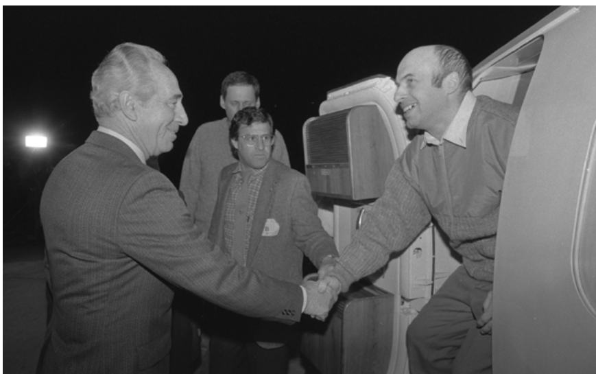
ראש הממשלה שמעון פרס מקבל את פני אסיר ציון נתן שרנסקי היוצא מדלת המטוס שהביאו לישראל מפרנקפורט, 1986

את זהותם היהודית ואת גאוותם. שרנסקי מתאר איך נלסון מנדלה, מנהיג מחאת השחורים בדרום אפריקה, פגש אותו לאחר שחרורו, כפגוש אסיר פוליטי ותיק את חברו. במהלך הפגיש, הוא אמר לשרנסקי: "קראתי את הספר שלך. מסכן, איזו זוועה עברה עליך", אמר. "עליי עברה זוועה?", תמה שרנסקי, "אתה הרי ישבת במאסר 27 שנה, פי שלושה ממני. ועליי עברה זוועה?" – "אבל לא הייתי בתנאים כמו שלך", השיב לו מנדלה. "כל החברים שלי למאבק היו איתי. למעשה, ניהלתי את המלחמה באפרטהייד מתוך כותלי בית הכלא. ממש לא הייתי לבד". – "גם אני לא הייתי לבד", השיב לו שרנסקי. "כל העם היהודי היה איתי. ידעתי והרגשתי זאת. מעולם לא הייתי לבד" (עמ' 108).