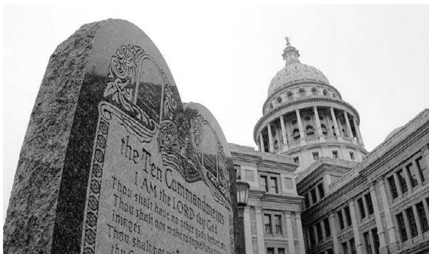
אין היתכנות לשמרנות ללא האל המקראי. עשרת הדיברות בחצר הקפיטול של מדינת טקסס, אוסטיין